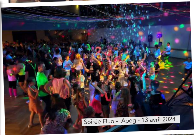
Soirée Fluo - Apeg - 13 avril 2024