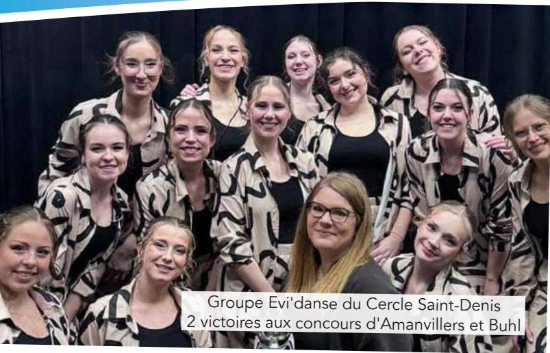
Groupe Evi'danse du Cercle Saint-Denis 2 victoires aux concours d'Amanvillers et Buhl