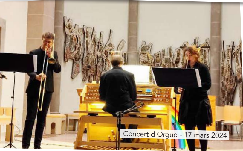
Concert d'Orgue - 17 mars 2024