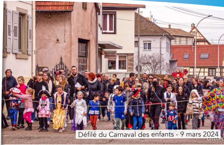
Défilé du Carnaval des enfants - 9 mars 2024