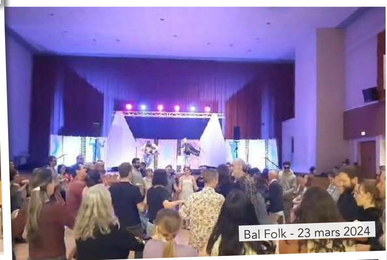
Bal Folk - 23 mars 2024