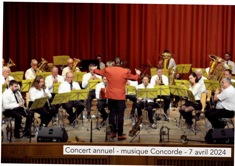
Concert annuel - musique Concorde - 7 avril 2024