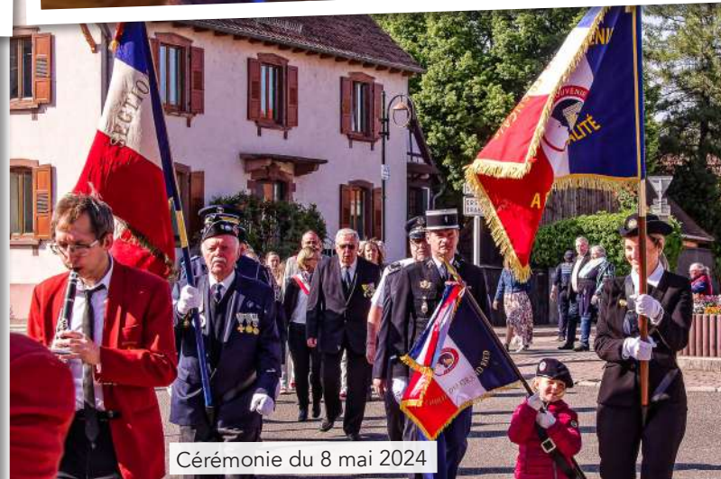
Cérémonie du 8 mai 2024