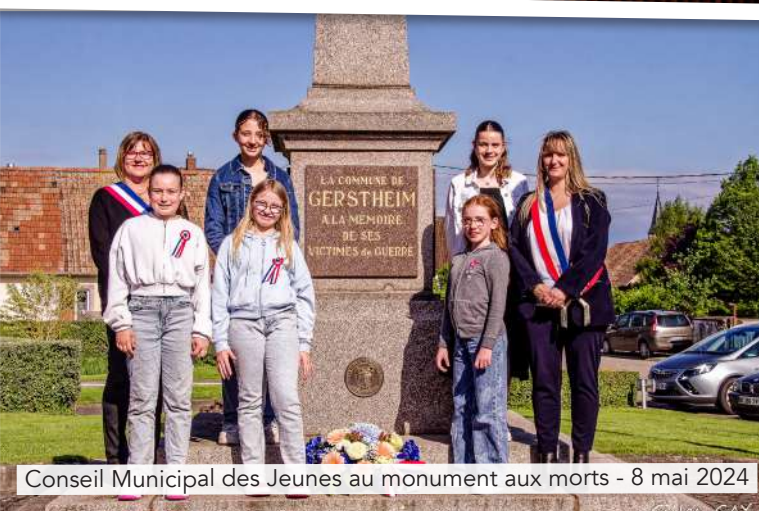
Conseil Municipal des Jeunes au monument aux morts - 8 mai 2024